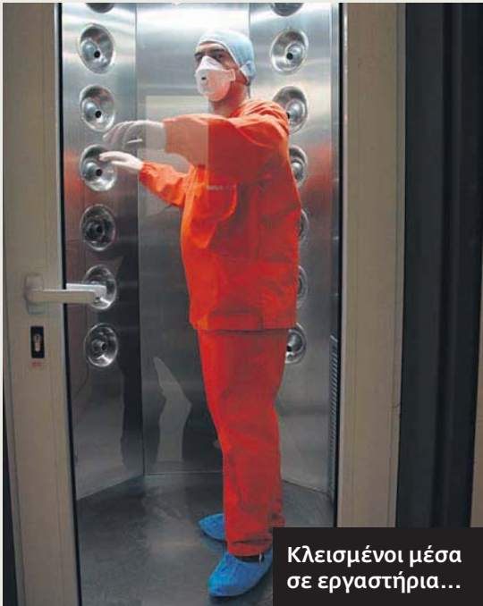
Κλεισμένοι μέσα σε εργαστήρια...