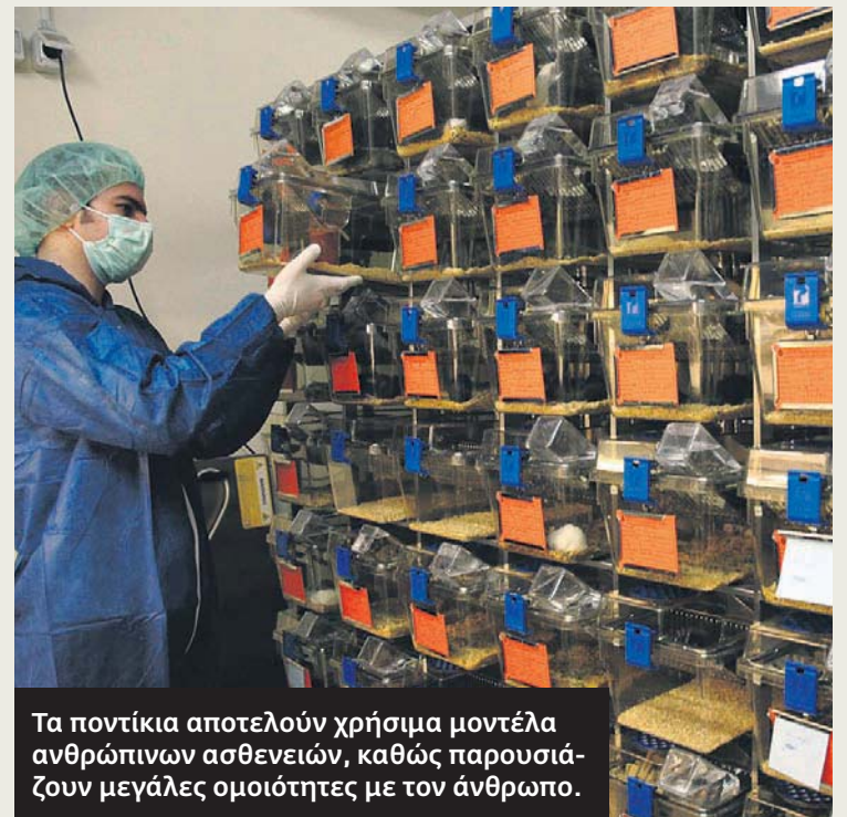
Τα ποντίκια αποτελούν χρήσιμα μοντέλα ανθρώπινων ασθενειών, καθώς παρουσιάζουν μεγάλες ομοιότητες με τον άνθρωπο.