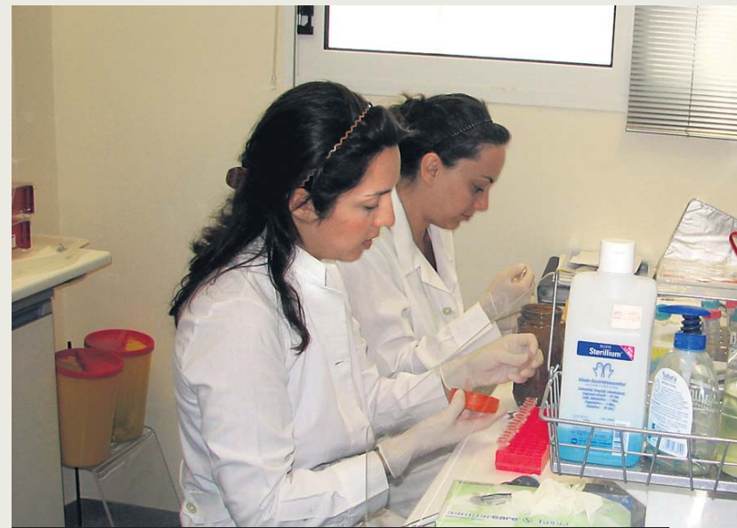
Με τα νευρικά βλαστοκύτταρα ασχολείται το Εργαστήριο Κυτταρικής και Μοριακής Νευροβιολογίας του Ινστιτούτου Παστέρ.